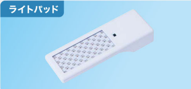
定格出力:5.0W 重量:170g 手元ON/OFF機能

背中や腹部など広い範囲への照射に有効的です。 LEDの光が均一に照射されしかもマイルドに作用 します。対象部位に近づくと自動でON、離れると 自動でOFFになる近接センサーも内蔵します。