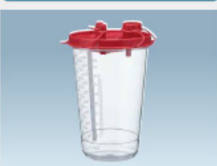
ディスポ吸引器用キャニスタ