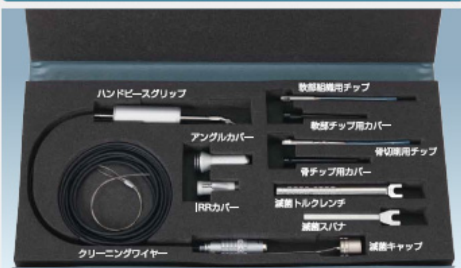
ハンドピース携帯ケース